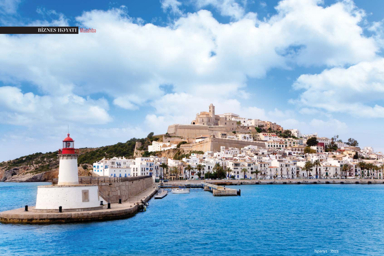
İspanya - Ibiza

- Son aylarda İspaniyada müşahidə edilən hadisələr böyük ciddiyət daşıyır. Katalunyada səsverənlərin hətta yarısını belə təmsil etməyə qadir olmayan regional partiyalar birliyi bütün İspan xalqının suverenliyindən sui-istifadə edərək, bütün Katalunya xalqının adından danışmaq istəyirdilər. Nə bütövlükdə, nə də katalonların çoxunu təmsil etmirlər. İspan xalqının suverenliyini əlindən ala bilməzlər. Bunun üçün İspaniya Konstitusiyası, Katalunya Muxtar Vilayətinin Nizamnaməsi və İspan qanunvericiliyini kobud şəkildə pozmuşdurlar. İndi Hüquqi Dövlət qanuna əsasən fəaliyyət göstərərək Katalunya seçicilərinin müstəqil şəkildə regional parlamenti seçmək imkanı yaratmaqdır.